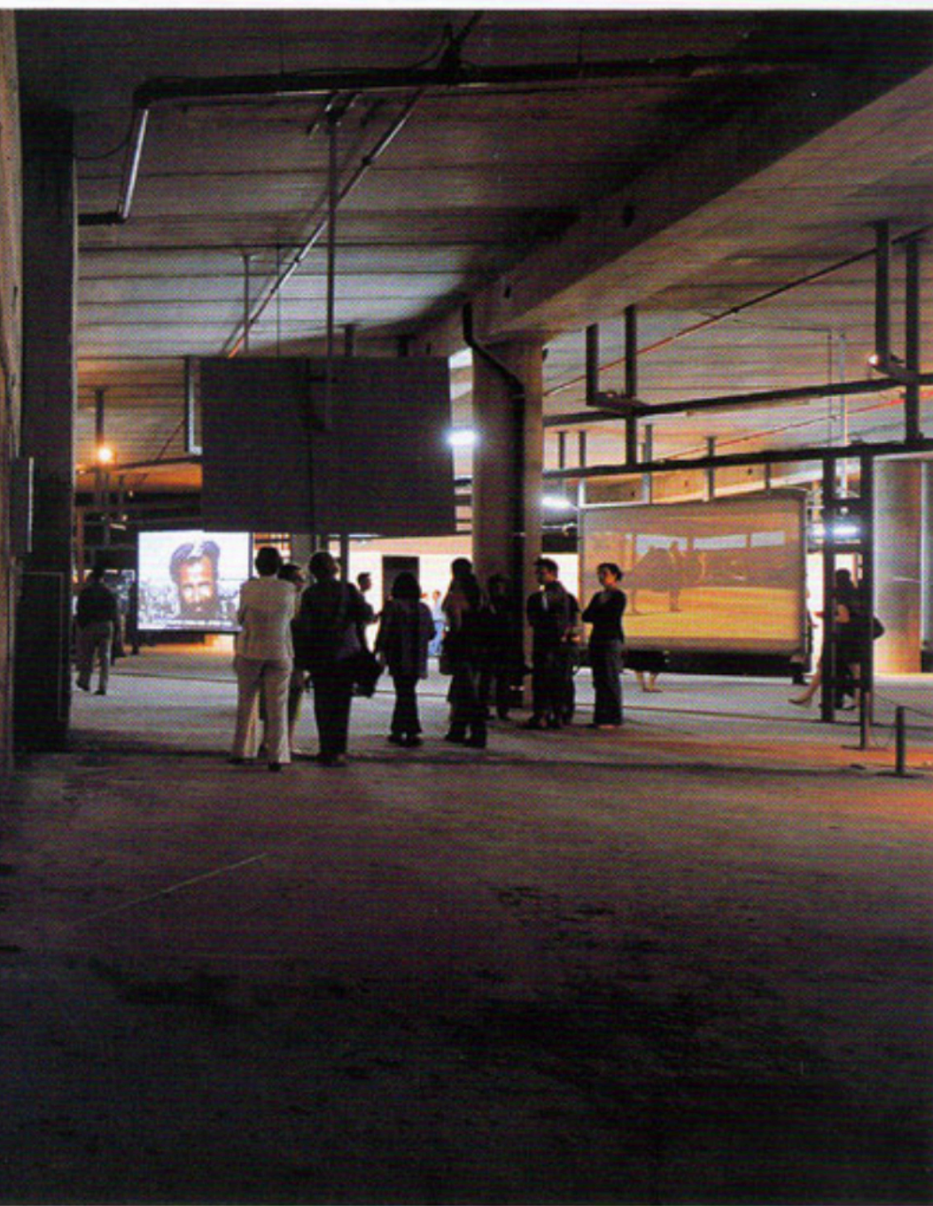
NIRA PEREG Sabbath 2008, Jérusalem 2008 , vidéo.

Tous les vendredis à la tombée du jour, le quartier ultra-orthodoxe de Mea Shearim se referme sur lui-même et la prière. L'artiste a filmé ses étonnants mouvements de grilles et de barrières, comme une chorégraphie.